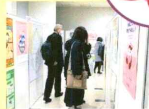
支援活動を紹介するパネル展示