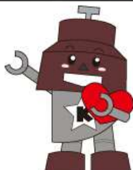
川口市マスコット 「きゅぼらん」

き：気づいて よ：寄り添って う：受け止めて し：信頼できる大人に つ：つなげる